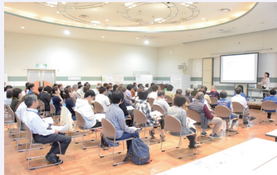
高知県内で活躍するいろいろな分野から12団体が出展し、沢山の方に参加していただきました。

「始めるきっかけ」、「ボランティアをする際気をつけたいこと」の4点をわかりやすく話してくださいました。