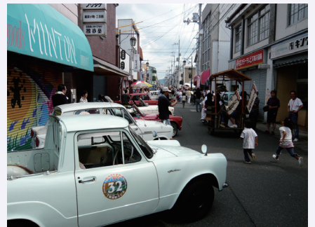
▲平成20年開催の「えびす昭和横丁」 (左の写真と同じアングルで撮影)

えびす昭和横丁ブログ https://blogs.yahoo.co.jp/ebisushouwa