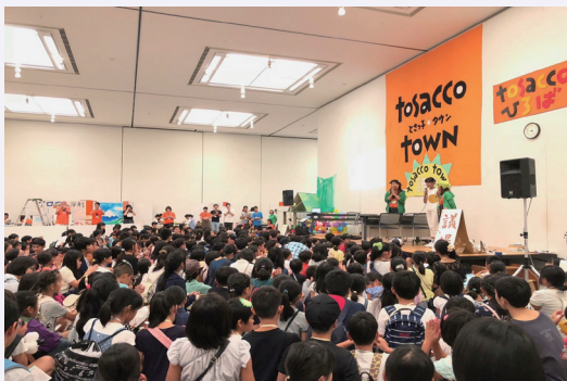
全体会では、大勢のこどもたちを前に説明しました

今年は、スタッフの思いも例年以上に強く、準備にも時間をかけてきました。私自身も強い思いを持って臨みました。1年をかけて会議を重ね、準備を行い迎える本番は、毎年のことながら感慨深いものです。今年も無事本番を迎えることができ、良かったです。