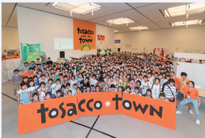
みんなの居場所 とさつ子タウン2018全員集合

づくきっかけにもなりました。とさつ子タウンはとても温かい場所です。そんなとさつ子タウンに出会えて良かったと心から思います。 とさつ子タウンは、これからも走り続けます。今後もこの事業に関わる皆さんにとって、ひとつの居場所であり続けますように。そして、これから関わり始める子どもたちにとっても新しい居場所になるように、これからも大切に、関わり続けていきたいです。