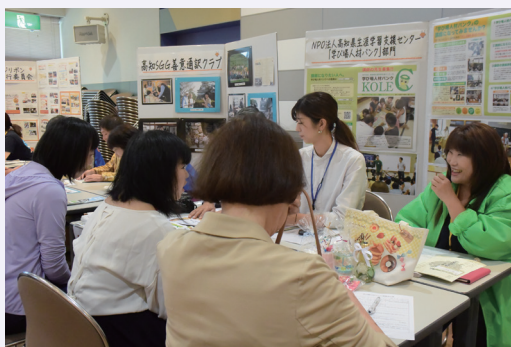
NPO 法人高知県生涯学習支援センター「学び場人材バンク」部門さんには、12名ほどが話を聞きに行かれて、その場で5名の方が登録されました。

今回のイベントで私自身も色々な団体の方と話すことが出来たので、参加できて良かったです。高知には私の知らないボランティア団体が沢山あるので、これからもこのような機会を大切にしたいと思います。（国際デザイン・ビューティカレッジ