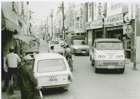
▲昭和30年代のえびす商店街